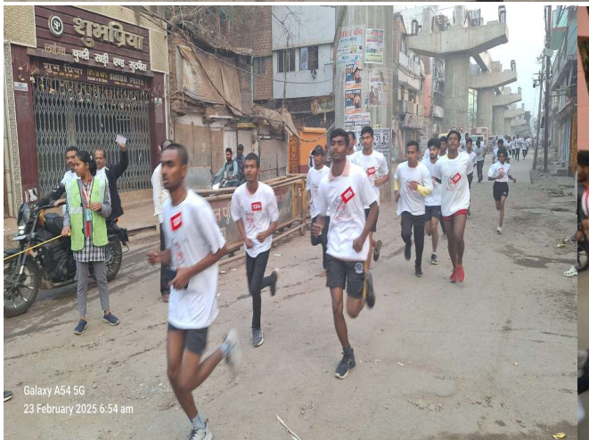
Galaxy A54 5G 23 February 2025 6:54 am