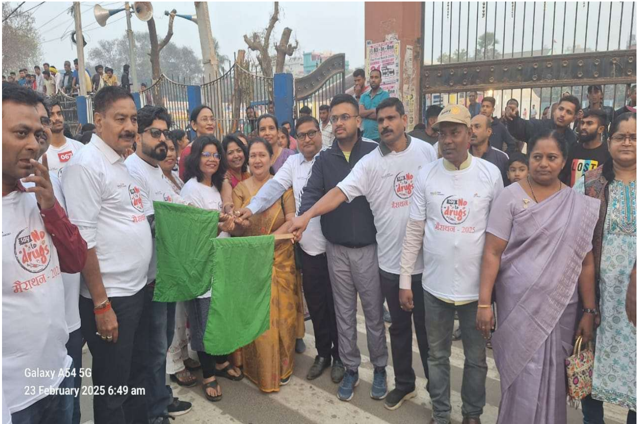
Galaxy A54 5G 23 February 2025 6:49 am