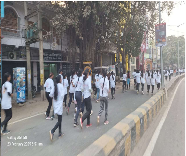
Galaxy A54 5G 23 February 2025 6:51 am