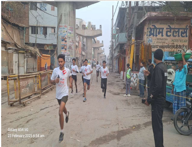
Galaxy A54 5G 23 February 2025 6:54 am