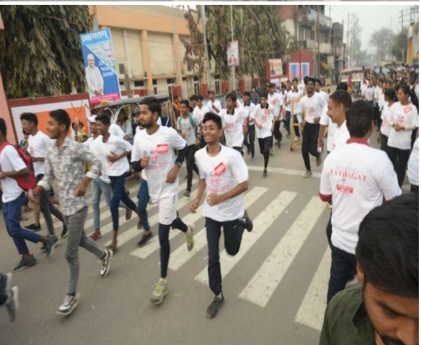
Galaxy A54 5G 23 February 2025 6:51 am