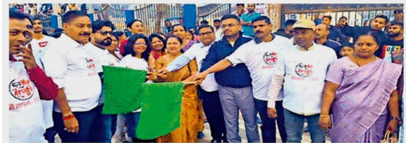
मैराथन दौड़ के हरी झंडी दिखाकर रवाना करते रोटरी एवं इनर व्हील सदस्य • जागरण

जास, बिहारशरीफ : 120 वें स्थापना दिवस पर रोटरी क्लब तथागत ने रविवार को मैराथन दौड़ का आयोजन किया। मैराथन का उद्देश्य युवाओं और आम जनता में इससे उपयोग के बारे में जागरूकता पैदा करना था। मैराथन के समापन अवसर पर वक्ताओं ने स्वास्थ्य और जीवन पर